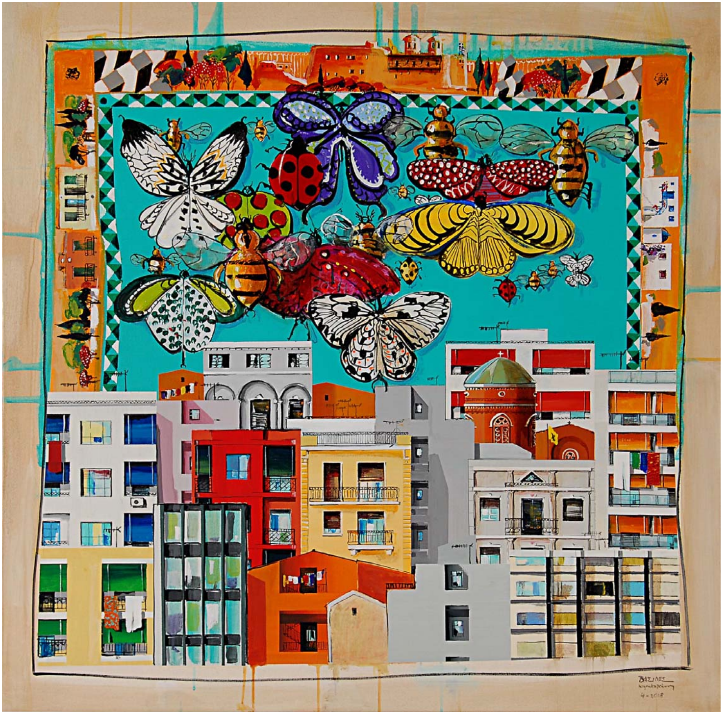
'Distinct District No10' 2018, 100X100cm. acrylic, gouache & oil on canvas