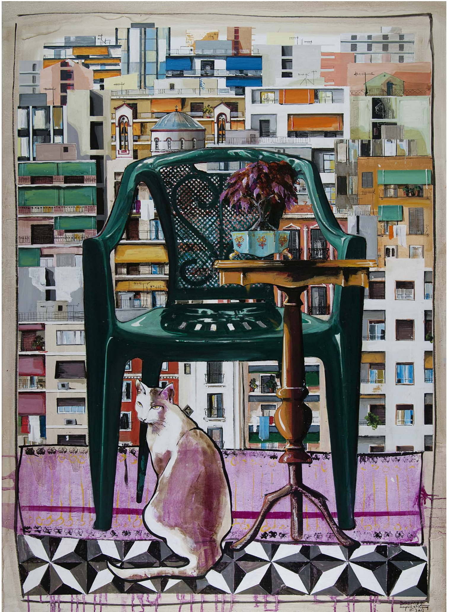
'Distinct District No2' 2017, 140X100cm. acrylic, gouache & oil on canvas