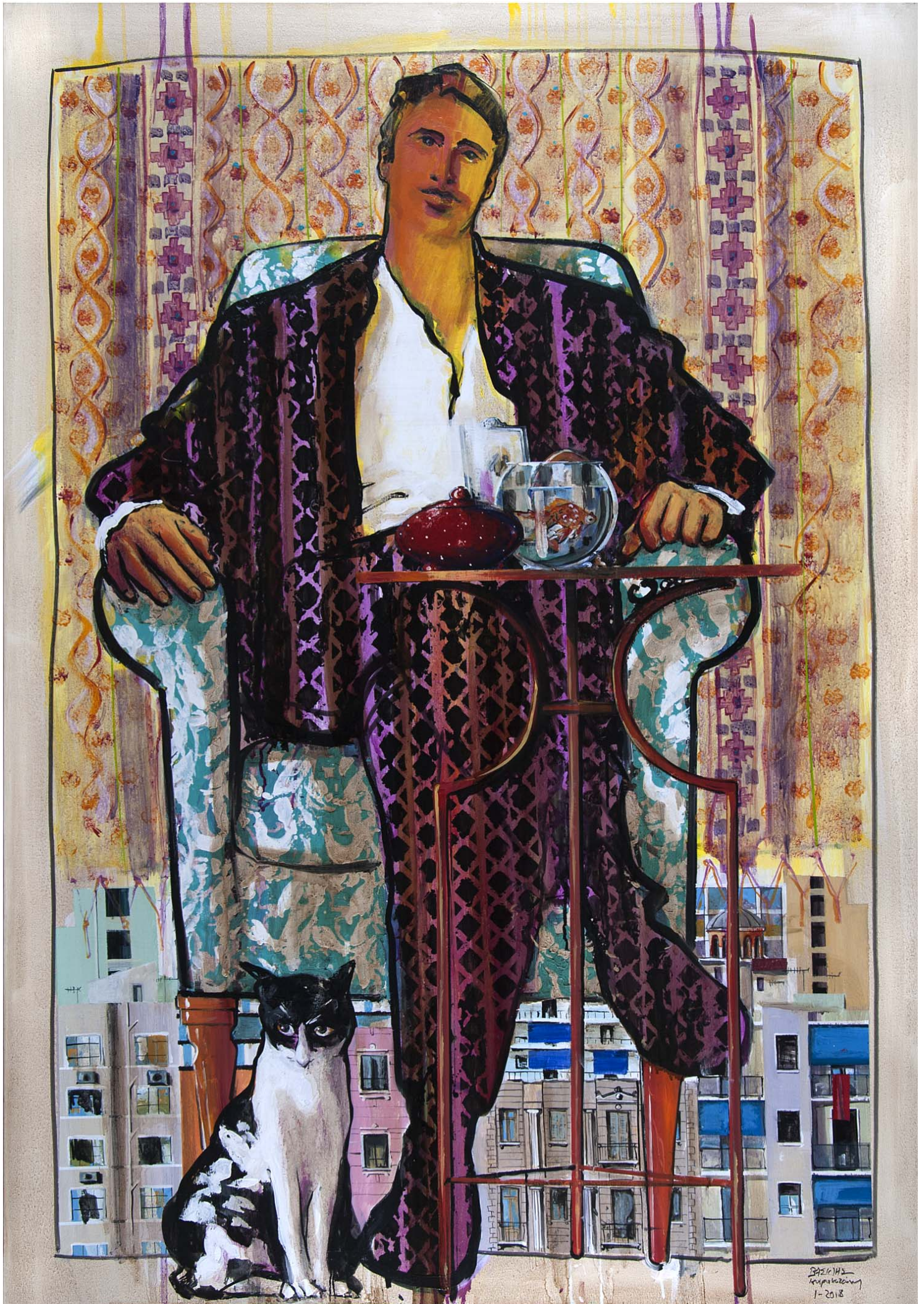
'Distinct District No3' 2018, 140X100cm. acrylic, gouache & oil on canvas