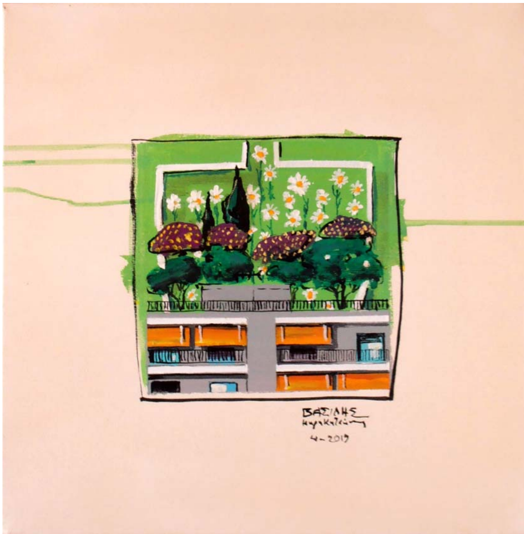
'Distinct District No45' 2019, 035X035cm. acrylic, gouache & oil on canvas