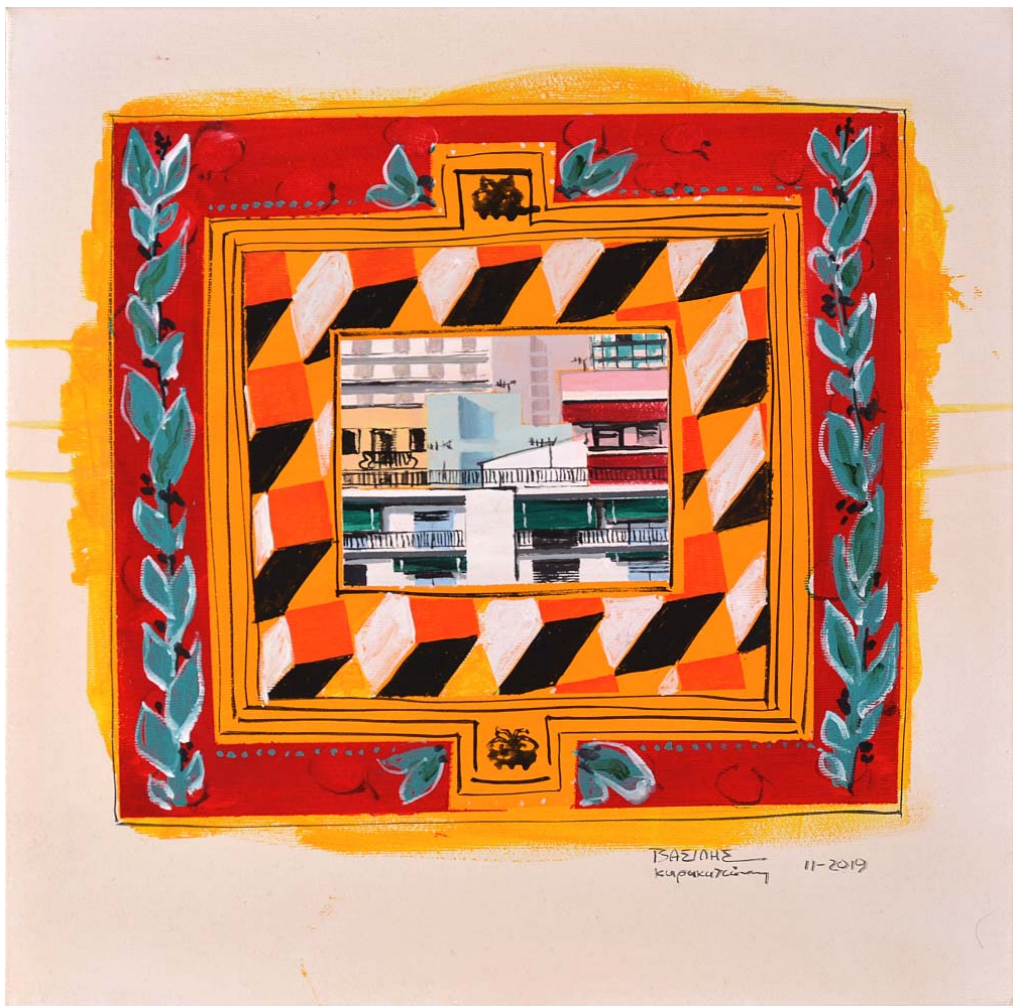
'Distinct District No56' 2019, 40X40cm. acrylic, gouache & oil on canvas 'Distinct District No57' 2019, 40X40cm. acrylic, gouache & oil on canvas