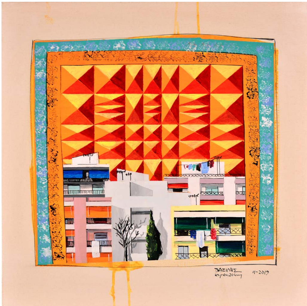
'Distinct District No50' 2019, 50X50cm. acrylic, gouache & oil on canvas 'Distinct District No51' 2019, 50X50cm. acrylic, gouache & oil on canvas