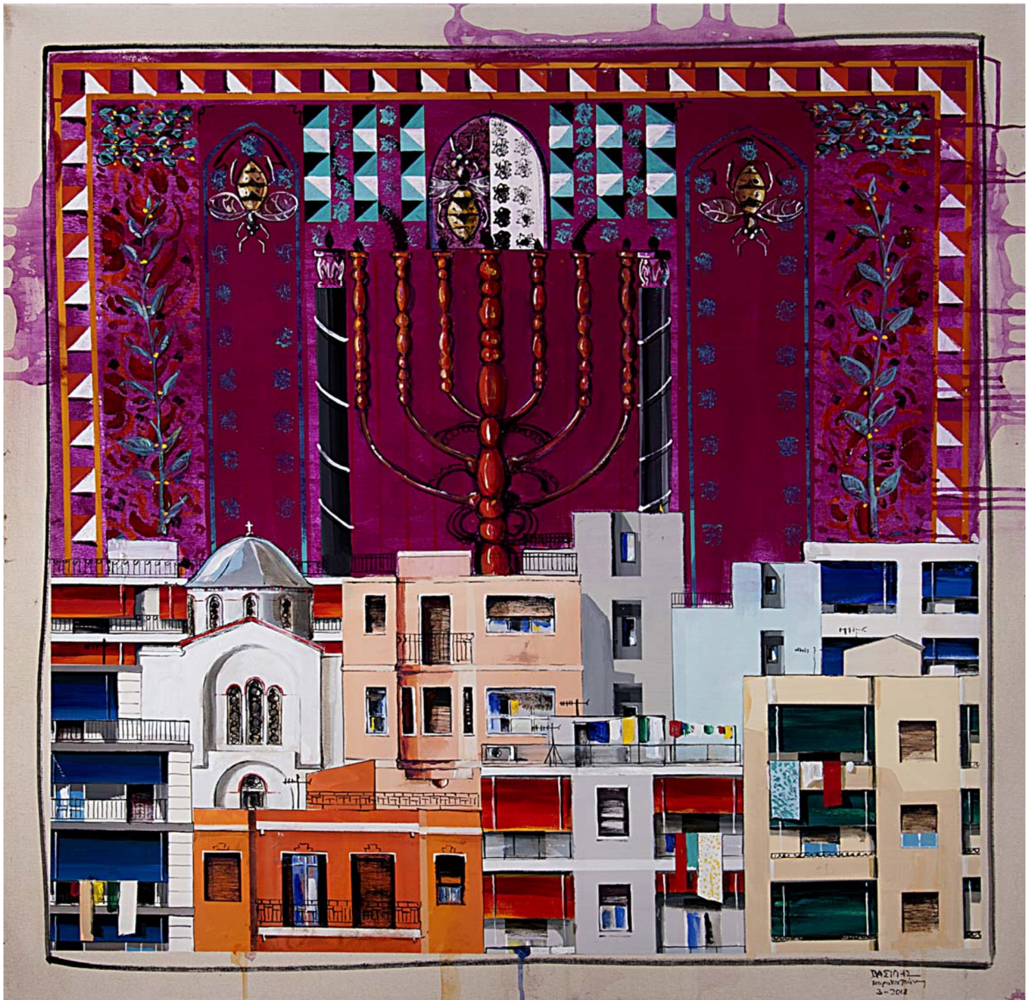
'Distinct District No8' 2018, 100X100cm. acrylic, gouache & oil on canvas