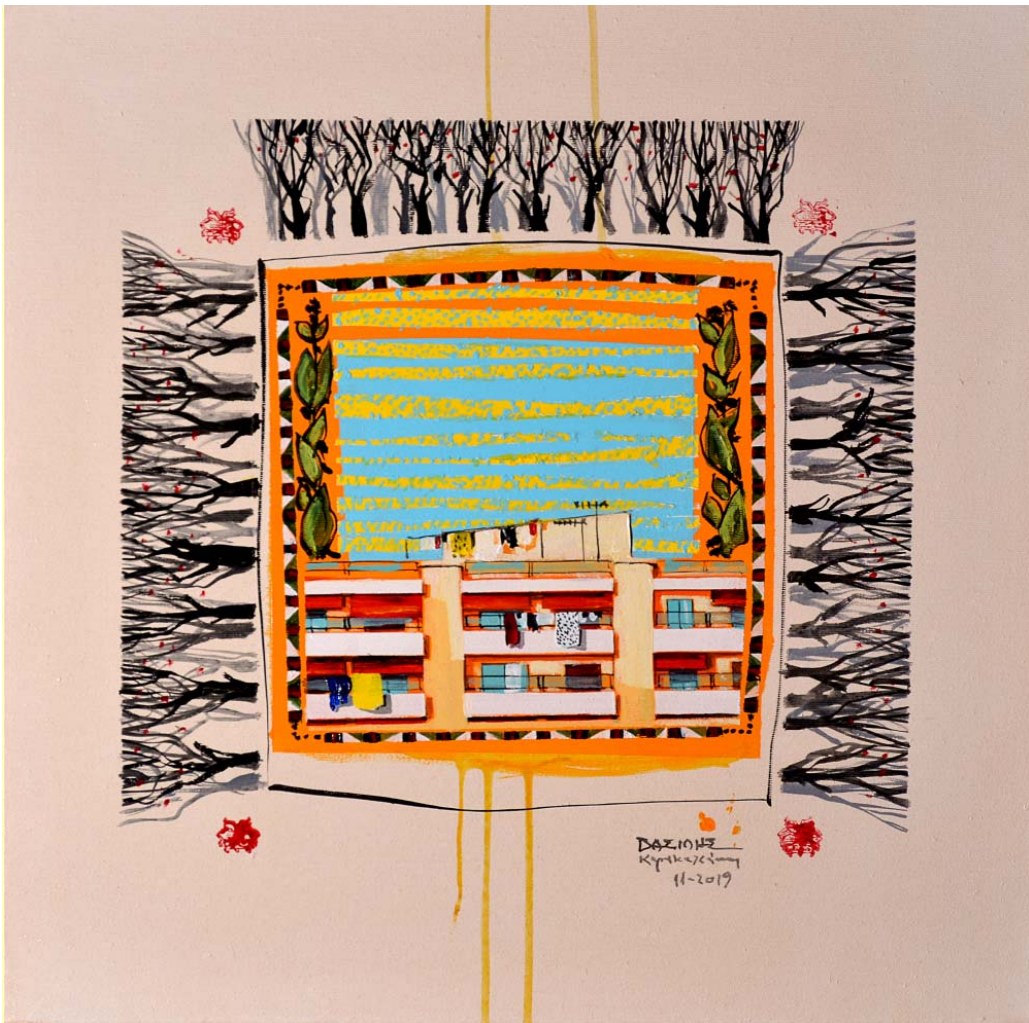
'Distinct District No52' 2019, 50X50cm. acrylic, gouache & oil on canvas 'Distinct District No53' 2019, 50X50cm. acrylic, gouache & oil on canvas