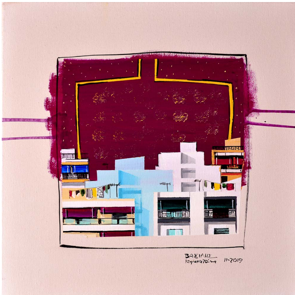
'Distinct District No54' 2019, 40X40cm. acrylic, gouache & oil on canvas 'Distinct District No55' 2019, 40X40cm. acrylic, gouache & oil on canvas