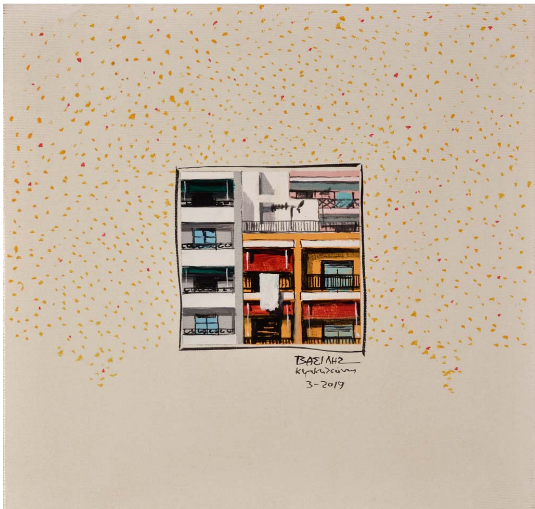
'Distinct District No32' 2019, 035X035cm. acrylic, gouache & oil on canvas 'Distinct District No34' 2019, 035X035cm. acrylic, gouache & oil on canvas