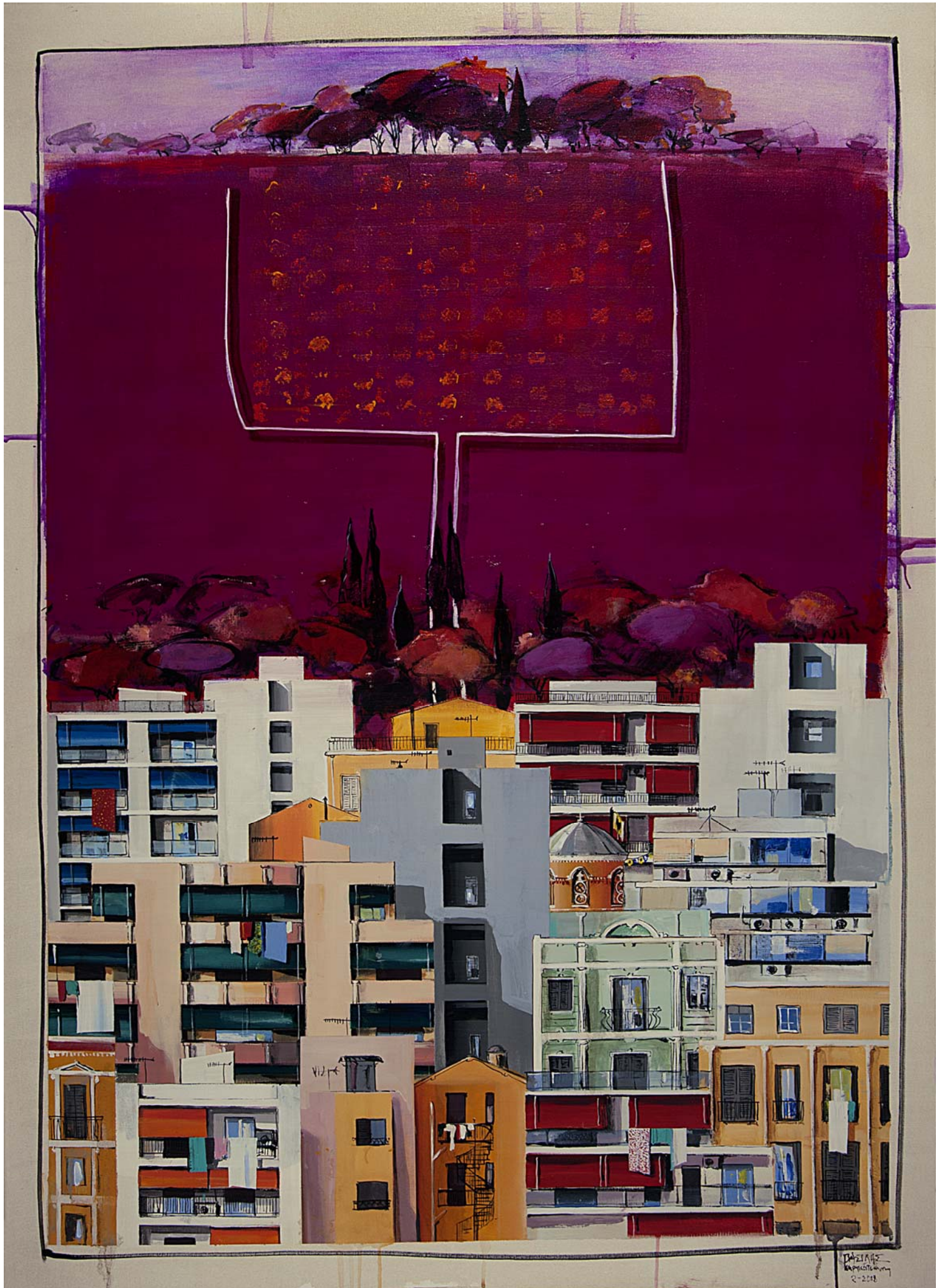
'Distinct District No6' 2018, 140X100cm. acrylic, gouache & oil on canvas