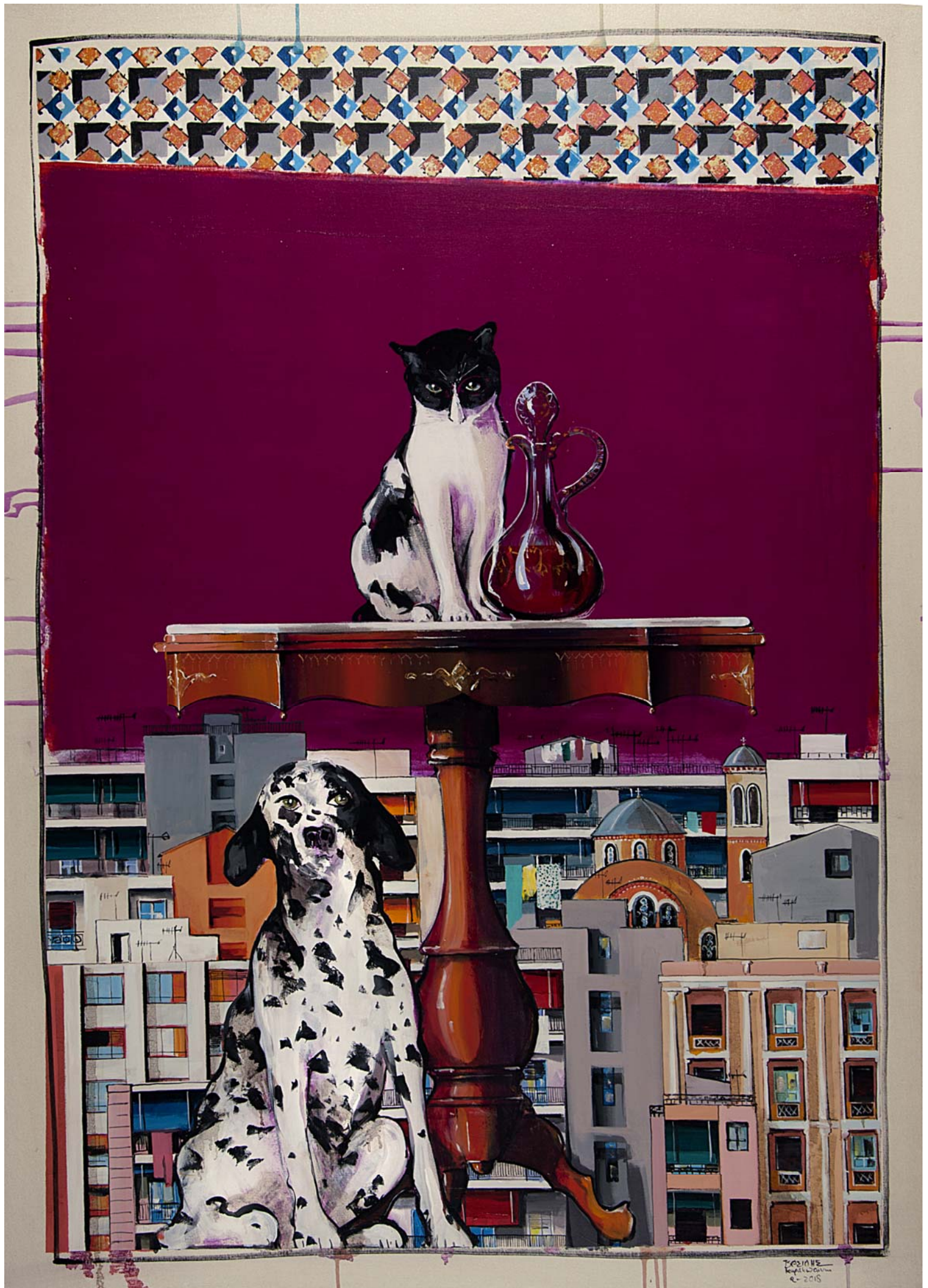
'Distinct District No7' 2018, 140X100cm. acrylic, gouache & oil on canvas