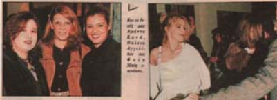
Η Γαμήλι με... Ο βασιλιάς της Βουλγαρίας...