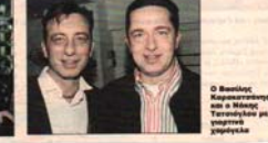
Ο βασιλιάς της Βουλγαρίας... Ο βασιλιάς της Βουλγαρίας...