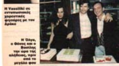
Η Γαμήλι με... Ο βασιλιάς της Βουλγαρίας...