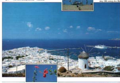
PHOTON IMAGE BY SPINNA 1997