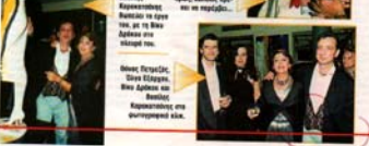
Η Γαμήλι με... Ο βασιλιάς της Βουλγαρίας...