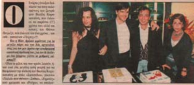
Η Γαμήλι με... Ο βασιλιάς της Βουλγαρίας...