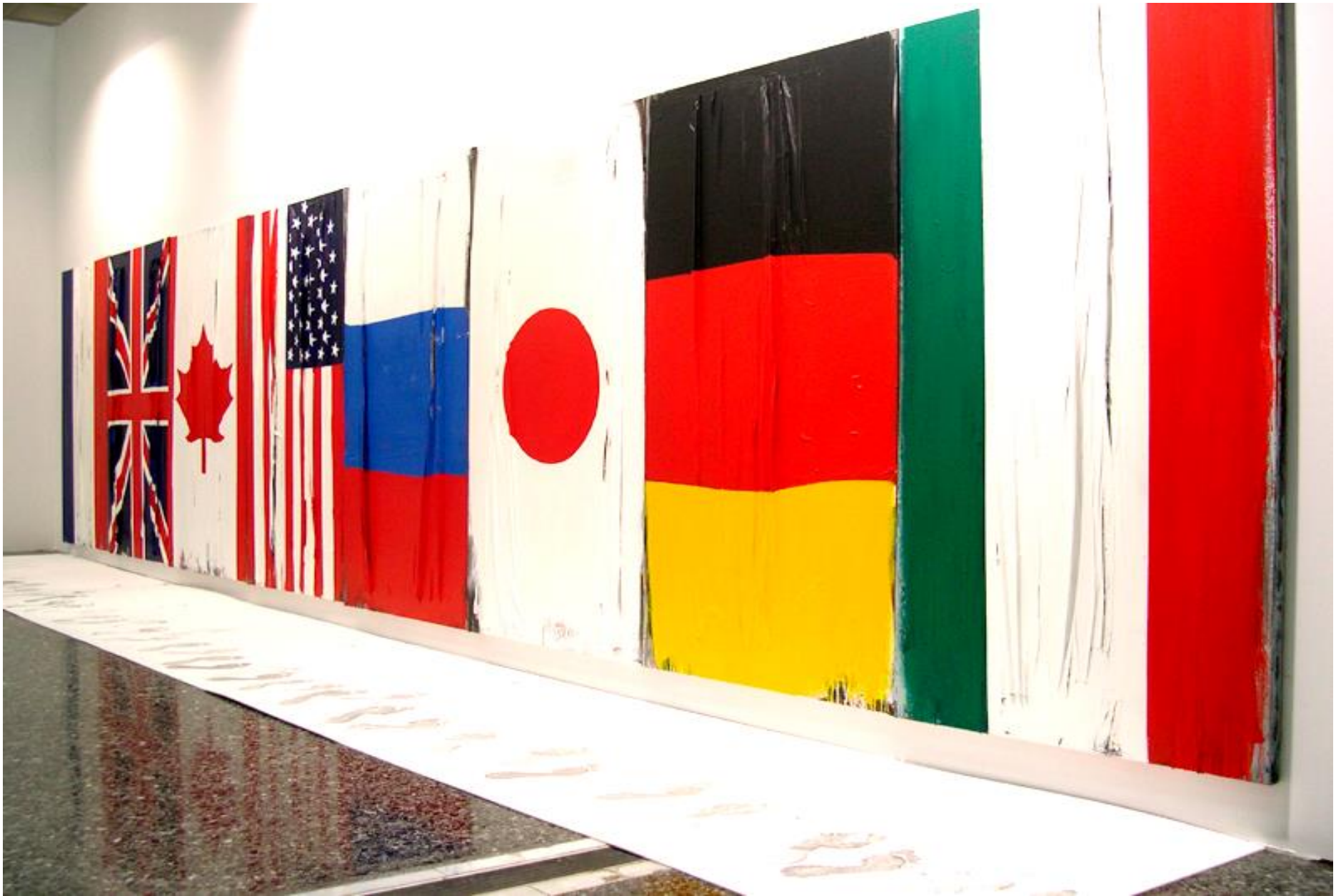
'G8+?' 2002 mixed media on canvas, installation 150X640X80 cm. Macedonian Museum of Contemporary Art collection, Thessaloniki, Greece