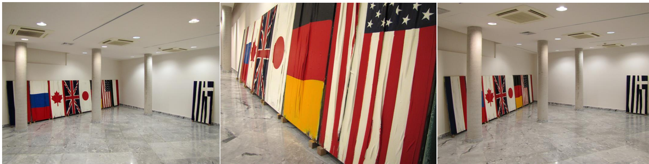
Italy, Russia, Canada, UK, Japan, Germany, USA, France & Greece

G8+? 2002 , installation: mixed media on canvas (150x640 cm. & 150x80 cm.) Macedonian Museum of Contemporary Art collection, Thessaloniki, Greece